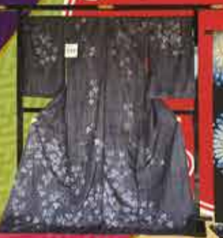
きものと帯コンテスト 2017年度大賞作品

丹波込めて紡がれた 西陣の新作きものと 帯が勢揃い。 貴様の投票によって 経済産業大臣賞ほか 名賞が決定されます。